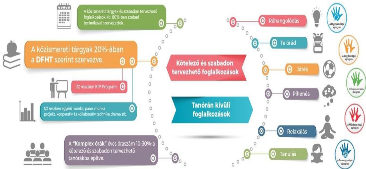
A Komplex Alaprogram tanítási-tanulási stratégiához kapcsolódó elemei